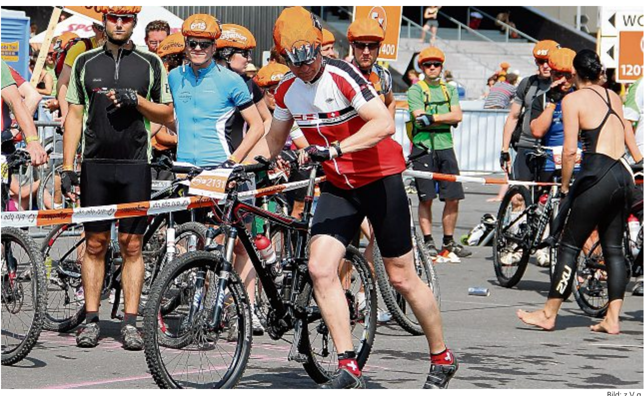
An diesem Wochenende ist die Kantonshauptstadt fest in der Hand der Ausdauersportler.